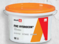
6 Farbe akurit FHC HYDROCON® Siikatfinish

ideen & Machen Gemeinsam für deinen Erfolg