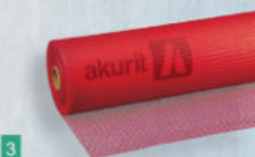
3 Ergänzungsprodukt akurit GF Armierungsgewebe fein