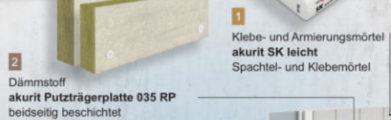
1 Klebe- und Armierungsmörtel akurit SK leicht Spachtel- und Klebemörtel

akurit MWP M Mineral überzeugt mit einer Wärmeleitfähigkeit von \lambda = 0,035 \text{ W/(m}\cdot\text{K)} .