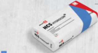
5 Oberputz und Schlussbeschichtung akurit HCS HYDROCON® Scheibenputz